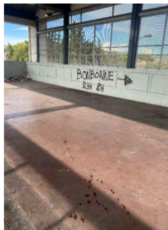
Illustration 2. Sortie du métro, un tag signale la possibilité d'acheter des bonbonnes aux horaires de nuit

Le vendeur est une personne qui vend les cigarettes dans la rue et qui s'est mise en juillet 2025 au commerce de bonbonnes de protoxyde d'azote.