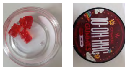
Illustration 3. Produits vendus en boutique CBD ayant relevé la présence de cannabinoïdes de synthèse

L'analyse des produits ayant provoqué ces effets a systématiquement révélé, quelques fois la présence de THC (la molécule psychoactive du cannabis), mais le plus souvent de cannabinoïdes de synthèse : sur 14 produits achetés en boutique CBD (gommes, cookies,